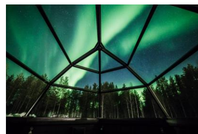
住宿觀賞極光度假小屋

安排晚上乘船河及晚餐，如幸運地也可遇上北極光。並於知名極光聖地拉普蘭地區住宿6晚，盡情享受雪地極光風情。