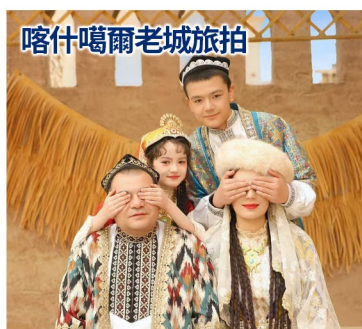
喀什噶爾老城旅拍

這種靜謐與日常，才是最能打動人的「家訪」。房子的每一個角落都精緻美麗，卻不是為了迎合遊客，而是日常累積出的真實之美：彩盤點綴的牆壁、精巧的器皿、燭臺與鮮花。這一刻，我們感受到的是真正屬於維族人的日常。