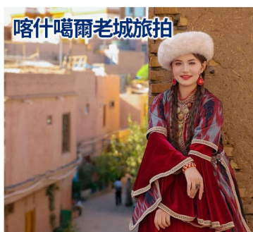
喀什噶爾老城旅拍