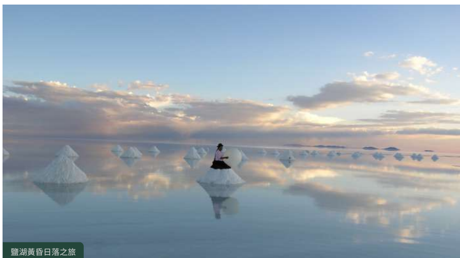
鹽湖黃昏日落之旅