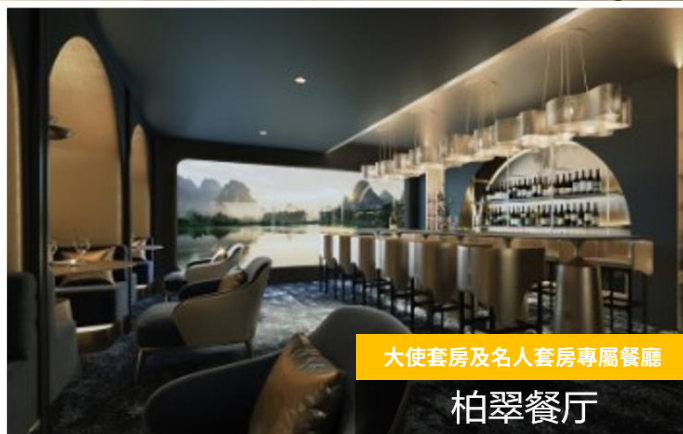
大使套房及名人套房專屬餐廳