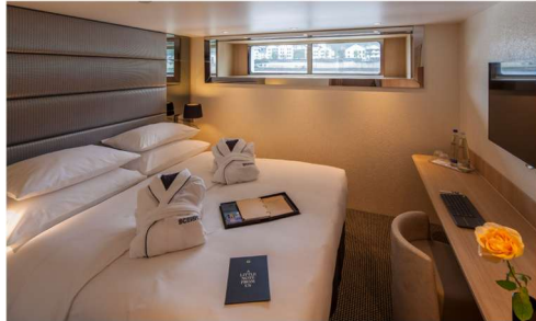
標準套房(Category E) 161 平方公尺