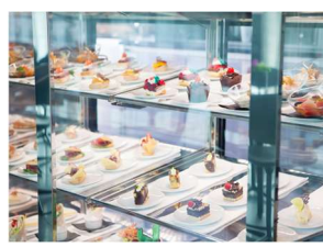
River Café 全天餐飲選擇小吃