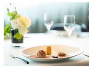
Table La Rive/ Table d'Or 10 位客人提供私密的用餐體驗