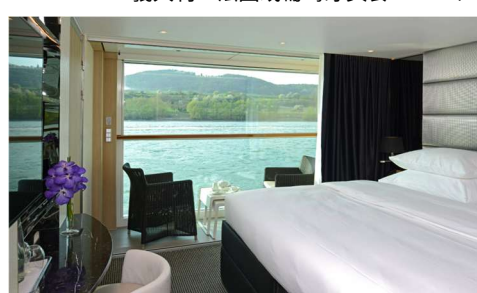
河景陽台套房(Category C/A) 205 平方公尺