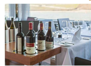
Crystal Dining 主餐廳