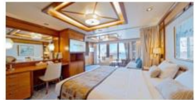
Premium Suite 豪華套房 Size 面積：48 m 2 Including Balcony 連露台 Deck 樓層：9-10