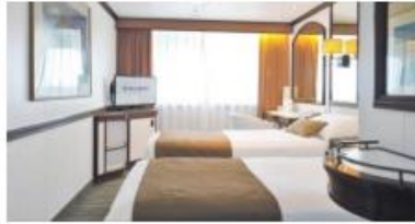
海景艙房 Outside cabin Size 面積：14 m 2 (II - Plus II) / 16 m 2 (Plus I) Deck 樓層：5-6 (II), 8 (I), 8 (Plus II), 9-11 (Plus I)