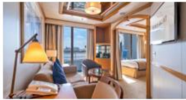
迷你套房 Junior Suite Size 面積：33 m 2 Including Balcony 連露台 Deck 樓層：10