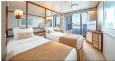
露台艙房 Balcony Cabin Size 面積：17 m 2 Including Balcony 連露台 Deck 樓層：9 (II), 10-12 (I)