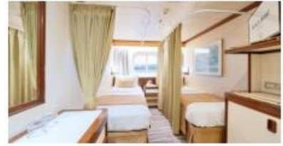
同行共享海景艙房 Semi-Single Outside (w curtain) Size 面積：14 m 2 Deck 樓層：5-6 (II), 8 (I)