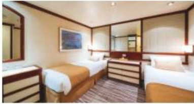
內艙房 Inside Cabin / 同行共享內艙 Semi-Single Inside (w curtain) Size 面積：13 m 2 Deck 樓層：8-12