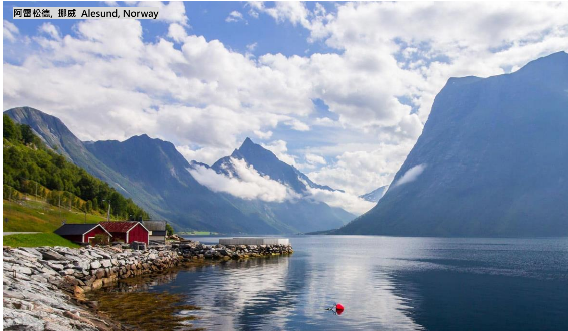
阿雷松德, 挪威 Alesund, Norway