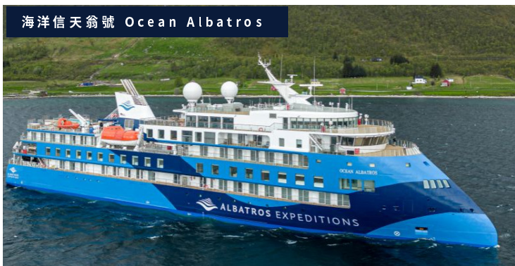
海洋信天翁號 Ocean Albatros

康克魯斯瓦克 最初於 1941 年作為美國運營的軍事基地建立。這些設施被重新用作格陵蘭的國際機場。來到康克魯斯瓦格，被這裡獨特的環境和文化所吸引，決心體驗一些獨特的體驗，例如觀賞北極光和沿著世界上僅有的兩片冰蓋之一徒步旅行。