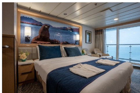
Balcony Stateroom 海景露台房 [Cat. C] (22m 2 )

費用已包括港務費及港口稅、機場稅及燃油附加費 +詳細行程請參考官方網站, 行程或登陸活動之安排因應當天天氣而由船公司決定。