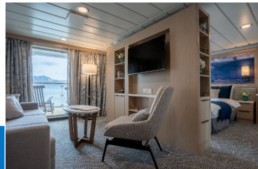
Junior Suite 精緻套房 [Cat. A] (40m 2 )