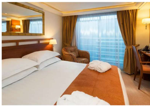
法式露台房 Category C/B (170 sq. ft.)