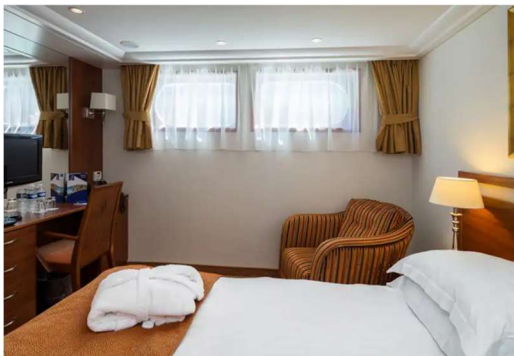
河景房 Category E/D (170 sq. ft.)

郵輪雜費約: HK$ 1,980 | 以上航程及船公司安排之指定岸上觀光活動只供參考，一切資料皆以船公司最後公佈為準，如有更改恕不另行通知。