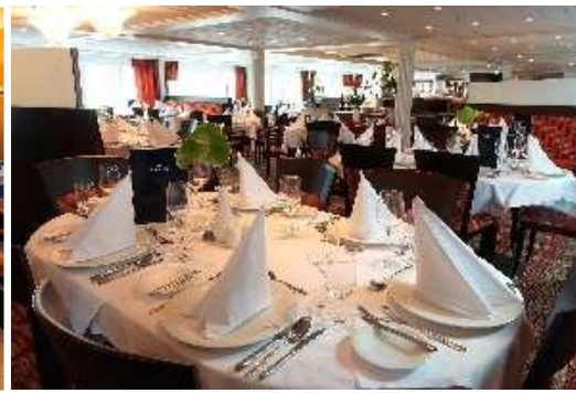
主餐廳 Main Restaurant

AmaCello 採用金色和橙色裝飾，繪製出歐洲絢麗的秋葉，是一場漂浮的愉悅。美麗的陽光甲板上設有舒緩的漩渦浴池、巨型棋盤和躺椅，讓您欣賞非凡的風景。飯店內，美麗的主餐廳和 The Chef's Table 特色餐廳飄出誘人的香氣，每間餐廳均提供由專業廚師使用新鮮的當地食材精心製作的菜餚。只要咬一口，您就會明白為什麼AmaCello像我們所有的歐洲船隻一樣，被納入國際知名烹飪協會 La Chaîne des Rôtisseurs ！大多數客艙都符合法式主題，設有法式陽台以及點播娛樂、恆溫空調和室內保險箱等設施。這艘令人難以置信的河船上還設有健身室、桑拿浴室和按摩室供您享用。