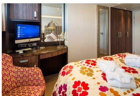
法式露台房 Category CB/CA (170 sq. ft.)