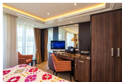
雙露台房 Category BB/BA (210 sq. ft.)