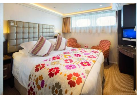
河景房 Category E/D (160 sq. ft.)

優雅的AmaLucia號是屢獲殊榮的AmaLea和AmaKristina的姊妹船，可容納156名乘客。這艘溫馨、舒適的遊輪提供奢華的空間，讓客人可以安靜地放鬆身心。從帶有雙陽台的舒適客艙（可讓客人透過娛樂點播、免費高速網路和Wi-Fi與外界保持良好聯繫）。當然，主餐廳和The Chef's Table 特色餐廳提供的精緻美食將滿足您在AmaLucia上的每個渴望。