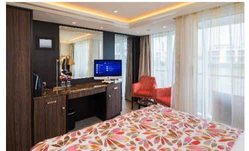
雙露台房 (河景及法式露台) (Cat. BB) 210 sq. ft.

船上將會為客人提供更多的餐膳選擇 · 包括主餐廳 · 特色餐廳 The Chef's Table · 更榮獲法國美食協會 (La Chaine des Rotisseurs) 認可, 膳食質素可見一斑 · 寬敞的甲板設有一個加熱游泳池和一個游泳池酒吧 · 提供放鬆身心的場所 · 而 Main Lounge 則每晚為客人提供的豐富多樣的娛樂節目安排。