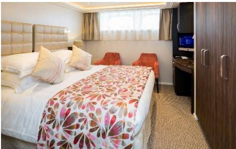
河景房 (Cat. D) 160 sq. ft.

AmaLea 船身長/闊 : 443 / 38 ft 首航年份 : 2018 年 載客 : 156 人 船員 : 51 人