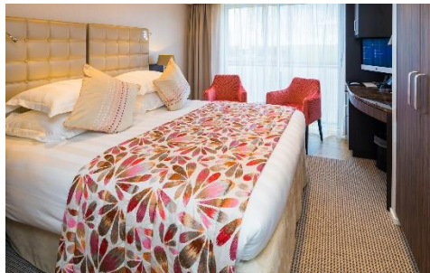
法式露台房 (Cat. CA) 170 sq. ft.