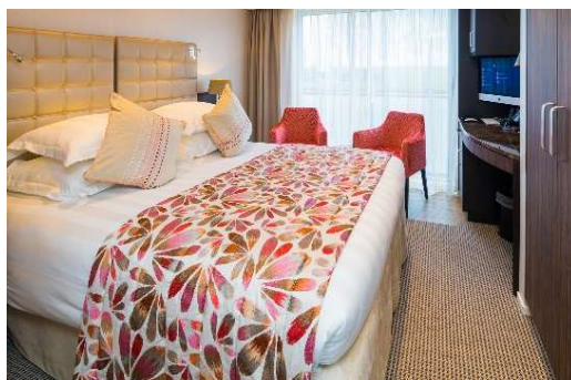
法式露台房 Category CB/CA (170 sq. ft.)