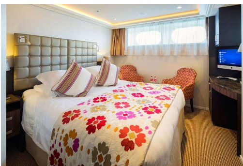
河景房 Category D (160 sq. ft.)

AmaMora 是我們屢獲殊榮的AmaLea和AmaKristina 的姊妹船，是一艘令人難以置信的雙陽台遊輪，擁有寬敞的私人空間、多種餐飲選擇和卓越的客艙舒適度。在船上，您可以享用全天供應的小吃菜單和下午茶以及 24 小時咖啡站，此外，主餐廳和 The Chef's Table 還提供 AmaWaterways 的招牌精緻當地美食。客艙配備了您輕鬆度假所需的一切，包括帶有免費高速網路和無線網路的隨選娛樂節目。如果您選擇套房，您將享受更大的休息區和寬敞的浴室，配有浴缸和獨立淋浴間，以及一張面向河流的床，因此您可以在壯麗的景色中醒來和入睡。