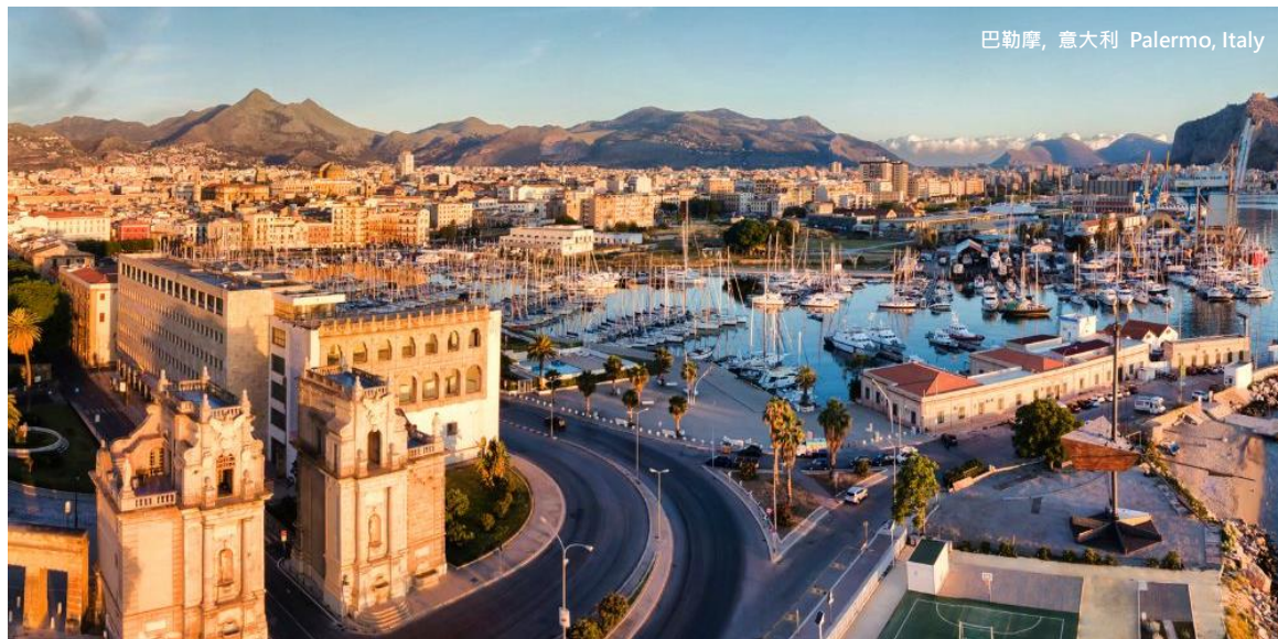
巴勒摩, 意大利 Palermo, Italy