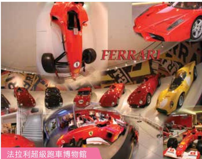
法拉利超級跑車博物館