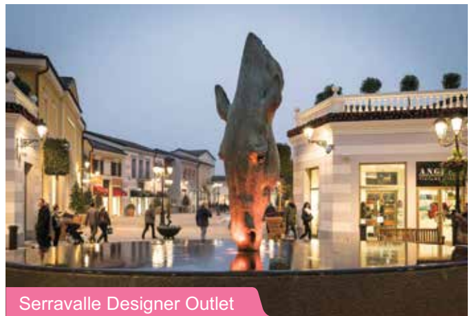
Serravalle Designer Outlet