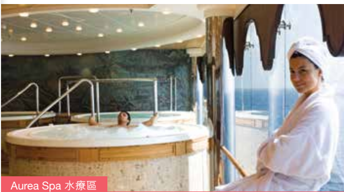
Aurea Spa 水療區